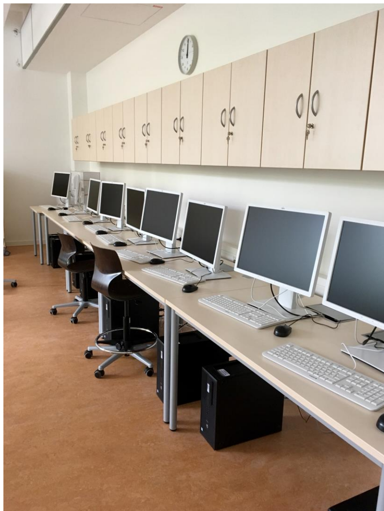
Fachraum Informatik S25