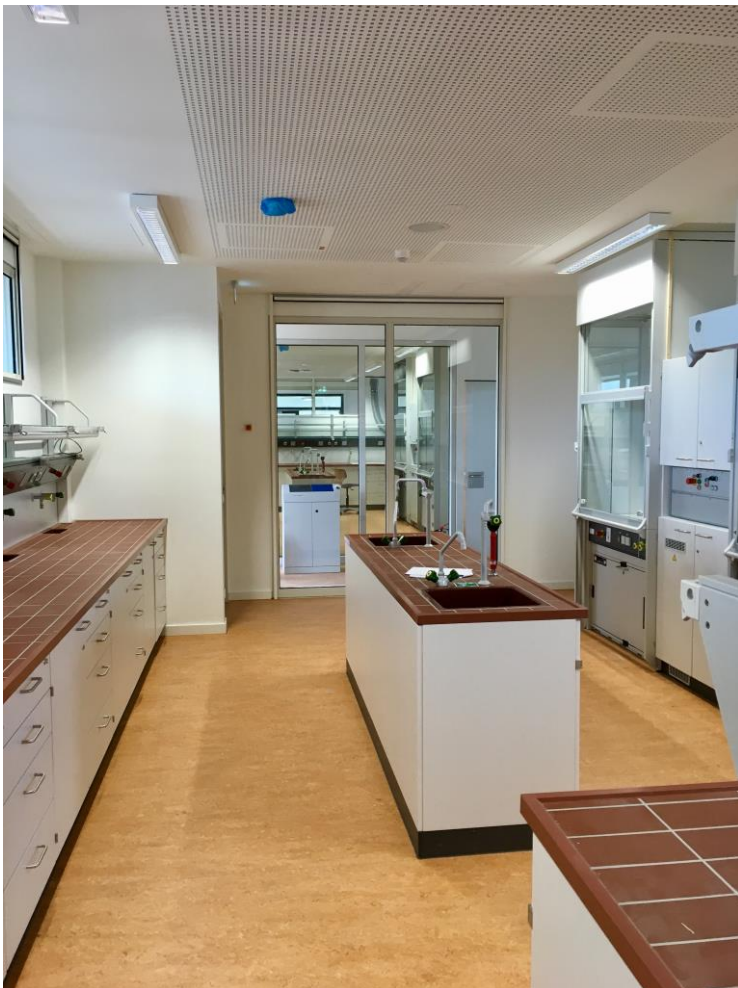
Schülerlabore Chemie S41 und S43