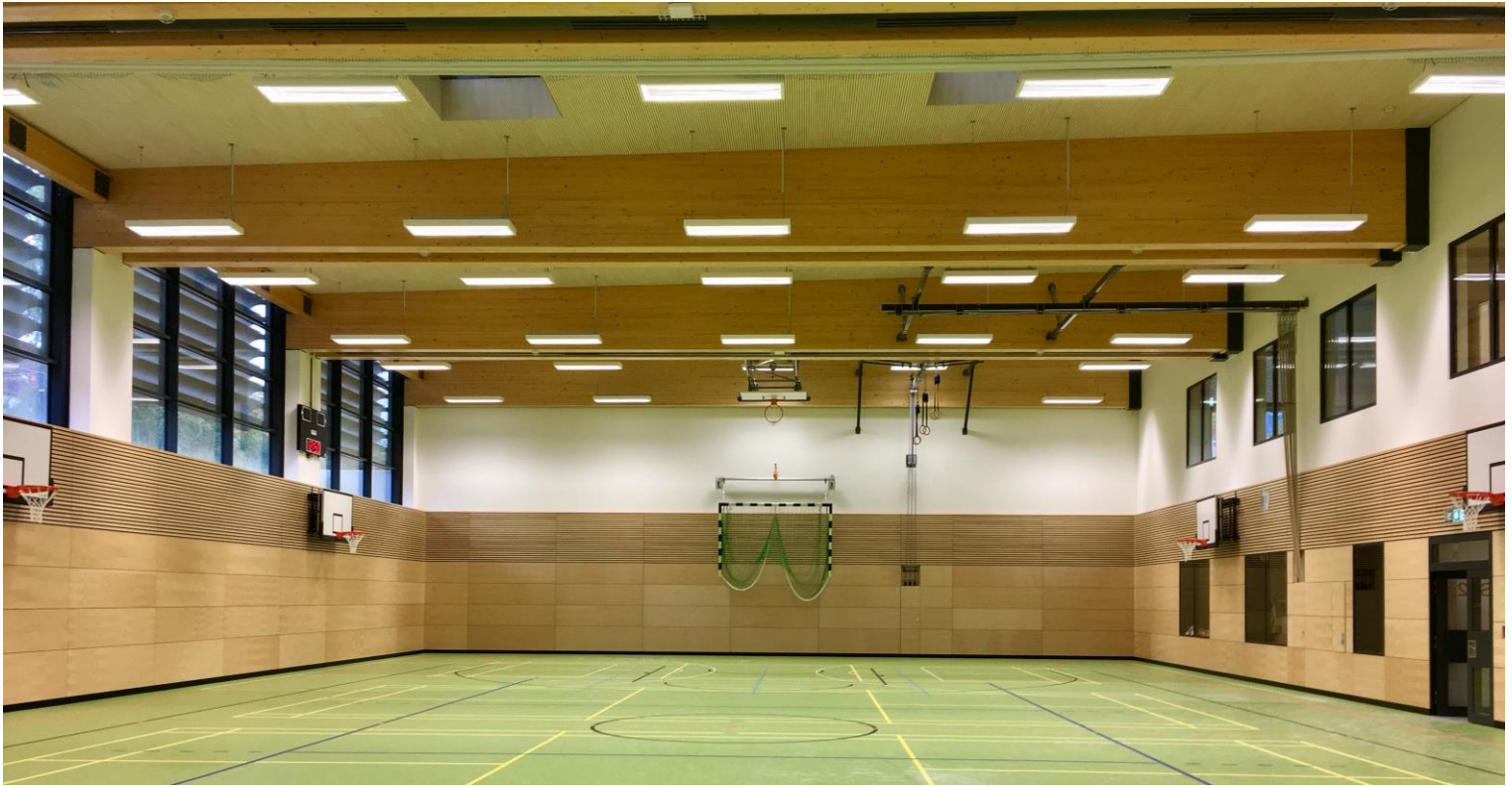
Zweifeldsporthalle S01 und S02